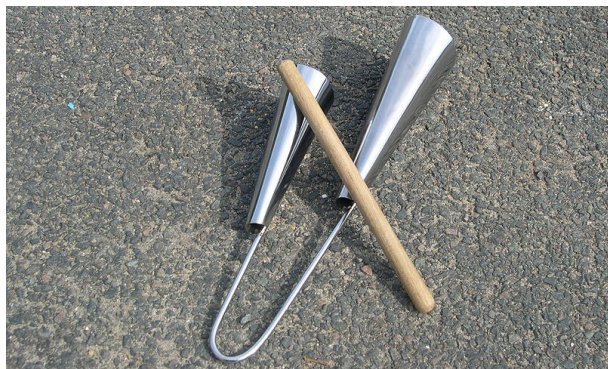
Figura 7: O agogô.

O agogô (Figura 7) empregado na capoeira possui duas campânulas de ferro e deve ser percutido com uma baqueta, preferivelmente feita em madeira para amenizar o som metálico produzido pelo agogô. Como a maior parte dos instrumentos da capoeira, a sua assimilação está relacionada ao candomblé, que também se utiliza do agogô durante a execução de alguns toques e em outros momentos do seu ritual. O agogô pode se apresentar sob mais de uma forma. Com três campânulas, quatro ou mais. Porém, na capoeira, a versão de duas campânulas é a mais utilizada (BRASIL, 2007).