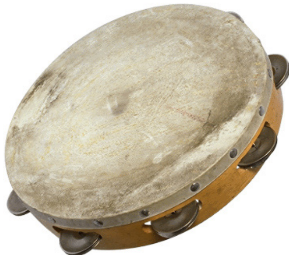
Figura 6: O pandeiro.