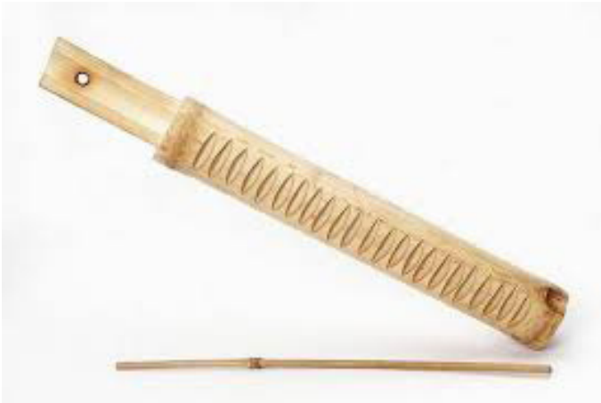
Figura 8: O reco-reco.

O instrumento chamado reco-reco (Figura 8) normalmente é feito a partir de algumas espécies de bambu ou da própria cabaça, quando esta apresenta uma forma mais alongada. A forma simples e rústica faz do reco-reco e do agogô os instrumentos de mais fácil execução na orquestra da capoeira. O som do reco-reco é produzido quando se desliza uma baqueta de madeira por sobre uma área entrecortada de sulcos transversais. A fricção da baqueta sobre a superfície da peça de bambu ou cabaça produz o som característico desse instrumento (BRASIL, 2007).