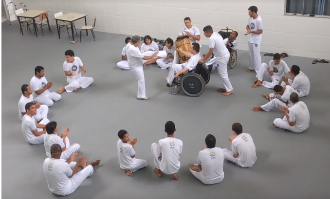
Figura 3: A roda de capoeira adaptada a pessoas com deficiência.