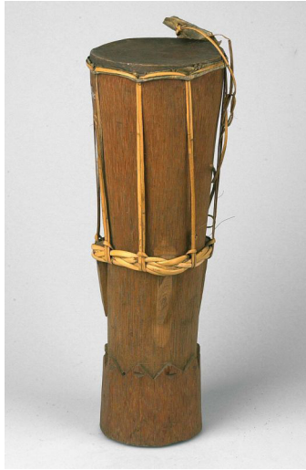
Figura 5: O atabaque.

adotados na capoeira, como fica demonstrado na Figura 1, de Rugendas, feita no séc. XIX. O atabaque da capoeira possui a mesma forma do n'goma , de origem angolana, e seus tamanhos variam dentro da configuração encontrada nos atabaques rum , rumpi e lé . Porém o mais adotado na capoeira, devido ao tamanho maior, e, conseqüentemente, por emitir um som mais grave, é o rum (BRASIL, 2007).