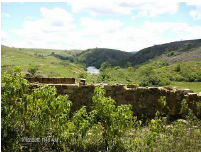
Figura 10: Vista do muro do antigo “Cemitério Particular da Fazenda Cachoeiro do Cravo” com o braço sul do Rio São Mateus ou Cricaré ao fundo.

do Major Antônio Cunha. O local guarda ainda as lembranças desse tempo de escravidão, dor e sofrimento. As histórias não podem ser esquecidas. É preciso gritar aos quatro ventos que há tempos uma mulher tornou-se guerreira e líder de um povo em busca de libertação. E essa história aconteceu tão perto de nós (PIVA e PIVA, 2014).