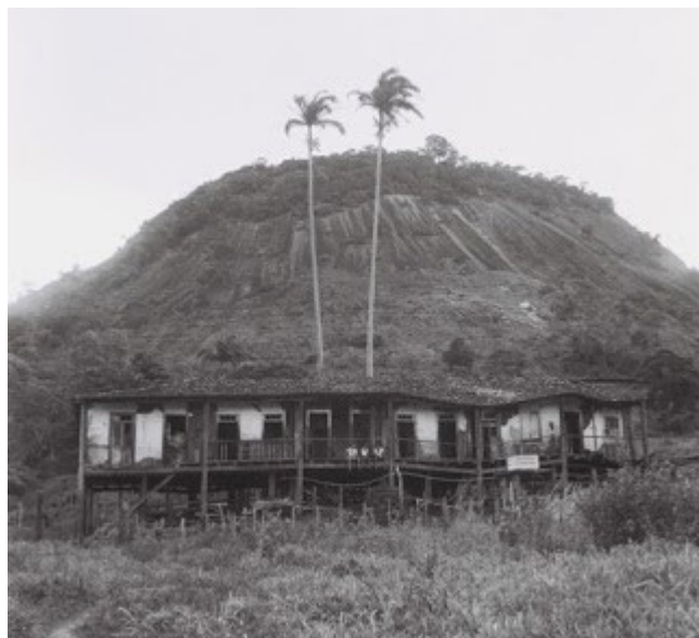
Figura 9: Ruínas da casa-grande, sede da Fazenda Serra dos Aymorés (atual localidade de Serra de Baixo) em 1981.

Essa história, contada pelos descendentes de escravos da região do Vale do Cricaré, emoldura a saga da colonização do município de Nova Venécia, que, antes chamada de sertão de São Mateus, surgiu no vale do rio Cricaré. São histórias de um povo que se misturava entre os sangues índio, negro, mineiro, nordestino e europeu. Da cidade de São Mateus, saíram os colonizadores, desbravando a mata, enviando seus escravos a abrir fazendas, a plantar cana-de-açúcar e café. Essa região recebeu montantes de italianos e outros povos europeus, além de imigrantes nordestinos que também trabalhavam nas lavouras ou nas casas-grandes. Uma dessas casas foi o casarão sede da antiga Fazenda da Serra dos Aymorés, na atual localidade de Serra de Baixo, em Nova Venécia, conhecido como Casarão dos Escravos (Figura 9), e que hoje, desaparecido, permanece vivo nas memórias dos moradores mais antigos (PIVA e PIVA, 2014).