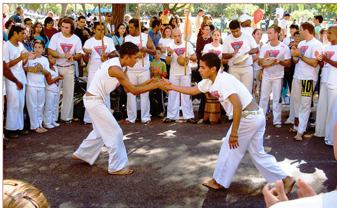
Figura 2: A roda de capoeira.

Segundo Reis (2010b), a roda de capoeira compõe-se, basicamente, de um círculo imaginário (embora alguns grupos e academias riscuem-no no piso) onde se desenvolve toda a ação. Ela possui, em média, três metros de diâmetro, onde em volta da mesma os capoeiristas permanecem (Figuras 2 e 3).